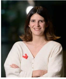
Clara Chappaz Directrice de la French Tech

« Nous sommes fiers de voir que les solutions de la French Tech sont de plus en plus utilisées dans notre pays, avec 62% des Français qui utilisent au moins une fois par mois des solutions des entreprises du French Tech Next40/120. Pourtant, le niveau d'utilisation de ces solutions par les administrations publiques (2,4% de l'achat public des ministères) et par les grandes entreprises (entre 0,1% et 0,5% des volumes d'achat) montre que le potentiel de transformation des start-ups est encore sous exploité.