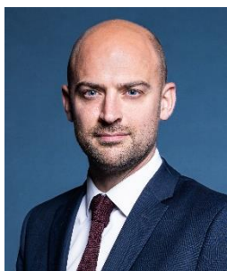
Jean-Noël Barrot Ministre délégué chargé de la Transition numérique et des Télécommunications

« La French Tech fête ses 10 ans cette année. Nous pouvons nous féliciter du chemin parcouru depuis 2013 où tout un écosystème restait encore à bâtir. Sous l'impulsion du Président de la République et grâce au travail et à la passion des entrepreneurs français, la French Tech rayonne dans notre pays et à l'international. Durant ces dix années, nous sommes parvenus à faire de la France un des pays les plus attractifs au monde pour les start-ups qui veulent se lancer, partir à la conquête des marchés internationaux et créer un avenir qui ait du sens.